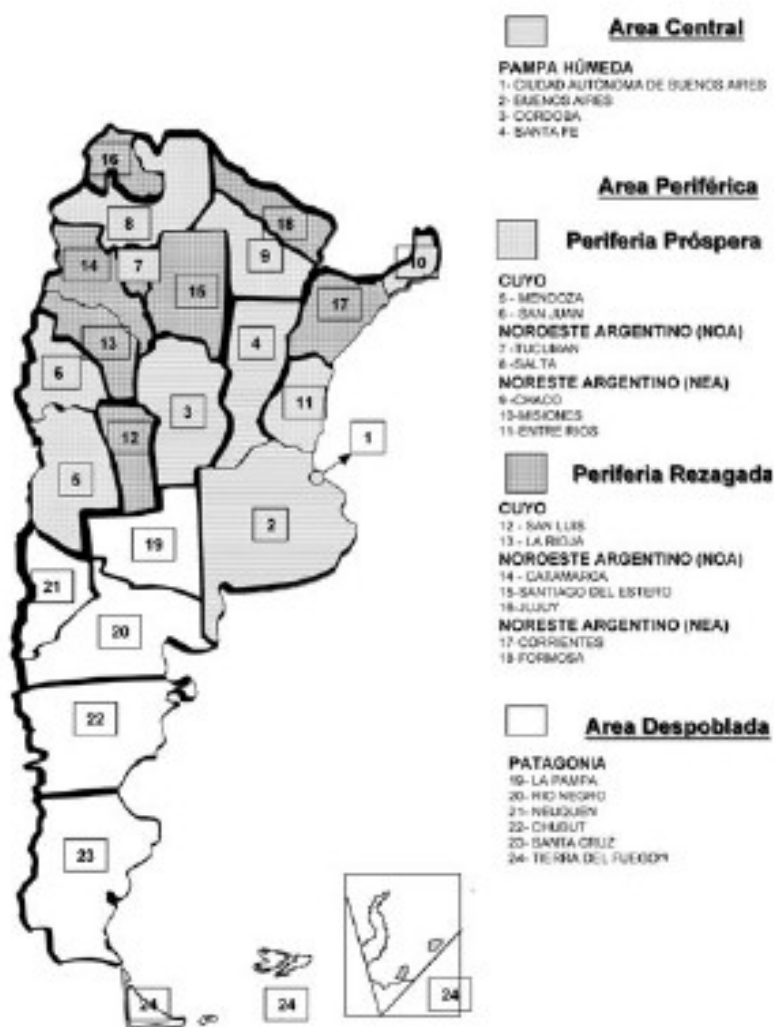
MAPA 2 EQUILIBRIO ENTRE REGIONES EN LA ETAPA ISI MEDIADOS DEL SIGLO XX

Notas: (1) El nombre completo es Provincia de Tierra del Fuego, Antártida e Islas del Atlántico Sur. Esta jurisdicción accedió al estatus de provincia en 1991.