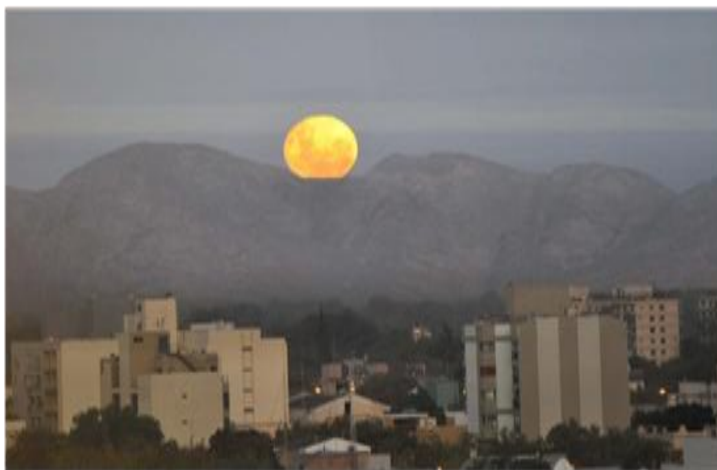
Luna Sanjuanina sobre el Pie de Palo, vista desde el Centro Cívico

"Escribo como medio y arma de combate, que combatir es realizar el pensamiento"