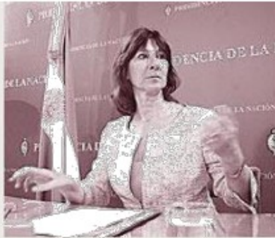
Felisa Miceli deberá superar las distorsiones en el ámbito del federalismo fiscal.